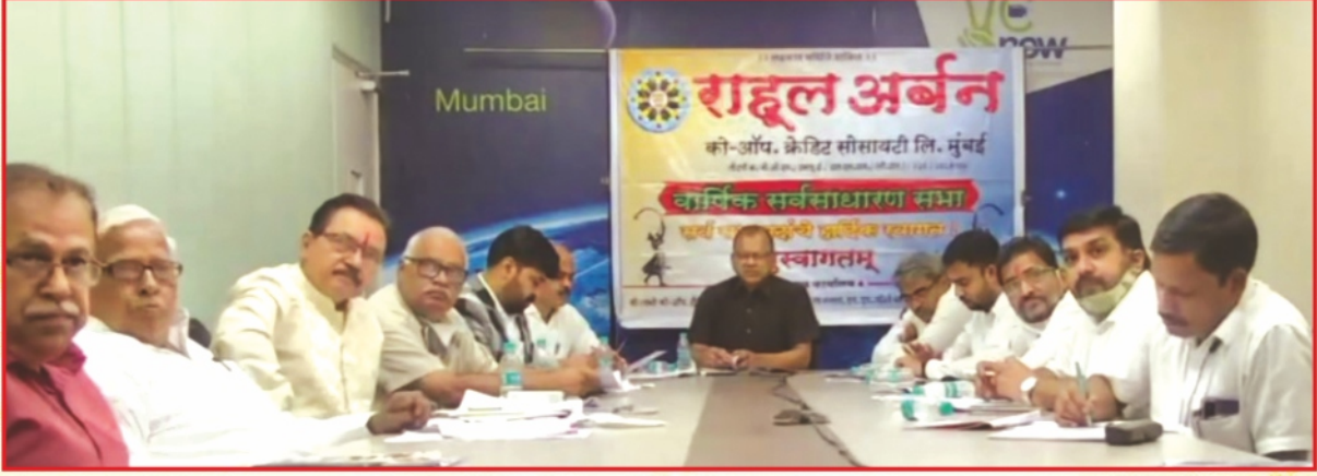
संस्थेच्या ३१ व्या ऑनलाईन वार्षिक सर्वसाधारण सभेप्रसंगी उपस्थित संचालक मंडळ