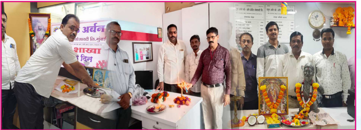
संस्थेच्या जुन्नर, मंचर व भायखळा शाखेच्या वर्धापन दिनांची क्षणचित्रे.