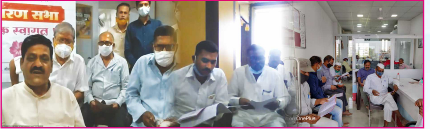
संस्थेच्या ३० व्या वार्षिक सर्वसाधारण सभेप्रसंगी ऑनलाईन विविध शाखेत उपस्थित सभासद बंधू.