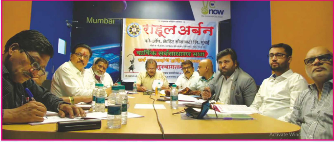
संस्थेच्या ३० व्या वार्षिक सर्वसाधारण सभेप्रसंगी उपस्थित संचालक मंडळ