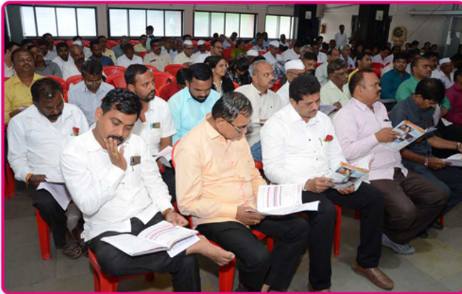
“प्रत्यक्ष” कल्याण येथील २९वी वार्षिक सर्व साधारण सभा दि. १८/०८/२०१९ क्षणचित्र